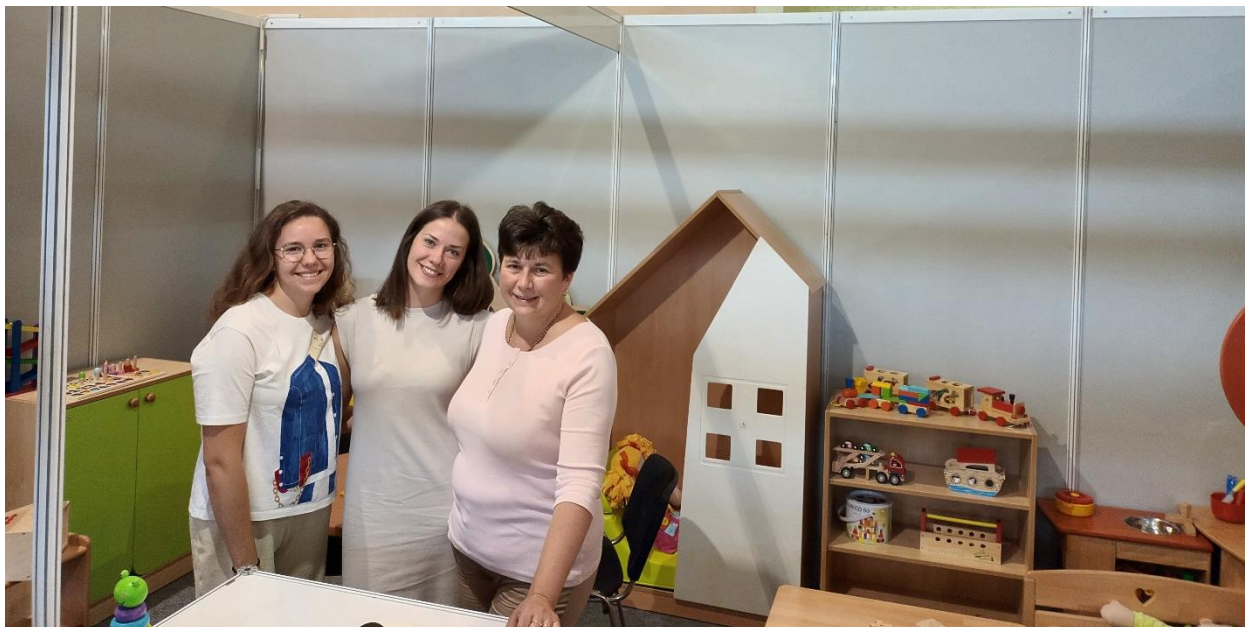
Stolarija Rusan Gornja Stubica

Stolarija Rusan iz Gornje Stubice na Zagorskom gospodarskom zboru kupcima uživo predstavlja naše proizvode. Bavimo se proizvodnjom namještaja za vrtiće i škole već 25 godina, a u koroni, smo pokrenuli internetsku trgovinu kako bi svi naši maloprodajni kupci svojoj djeci u svojim domovima, a ne samo u vrtićima ili školama, mogli omogućiti didaktičke igračke, opremu i namještaj. Koristimo ekološke boje.